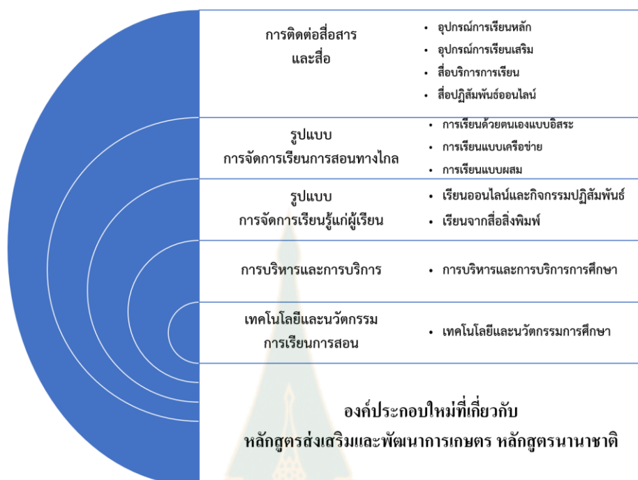
ภาพที่ 5.1 องค์ประกอบใหม่ที่เกี่ยวข้องกับหลักสูตรส่งเสริมและพัฒนากิจกรรม หลักสูตรนานาชาติ

ผู้วิจัยได้ตั้งสมมติฐานการวิจัยไว้ จำนวน 2 ข้อ ได้แก่ 1) ปัจจัยองค์ประกอบการพัฒนาหลักสูตร มีความสัมพันธ์กับความเป็นประโยชน์ของหลักสูตร และ 2) ปัจจัยองค์ประกอบการพัฒนาหลักสูตร มีความสัมพันธ์กับความต้องการเข้าร่วมหลักสูตรของนักศึกษา โดยใช้สถิติการวิเคราะห์สหสัมพันธ์ จับคู่ตัวแปรในแต่ละชุด